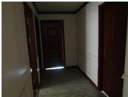
估价对象 6 楼