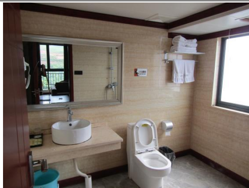
估价对象 5 楼卫生间