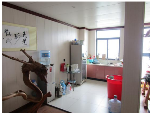
估价对象 6 楼室内