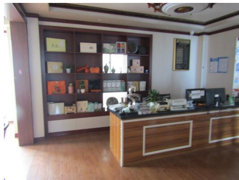
估价对象 6 楼室内