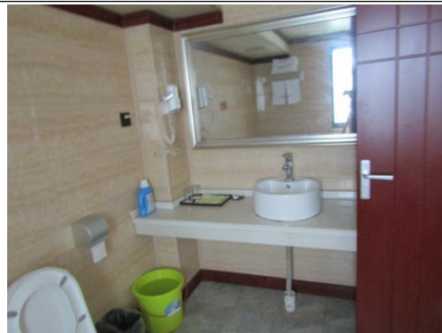
估价对象 5 楼卫生间