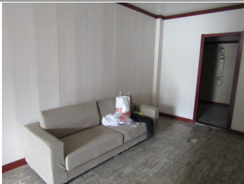
估价对象5楼入户门