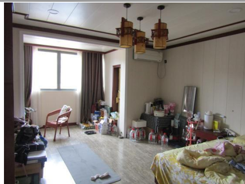
估价对象 6 楼室内