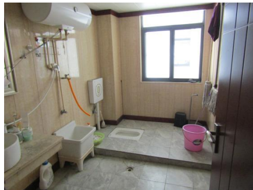
估价对象 6 楼卫生间