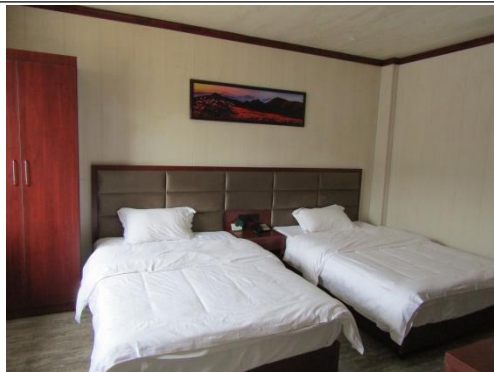
估价对象 6 楼室内