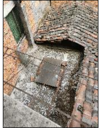
1层单独建筑外部状况