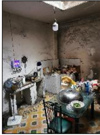
1层单独建筑内部状况