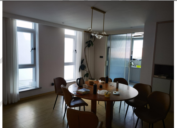
估价对象现场状况