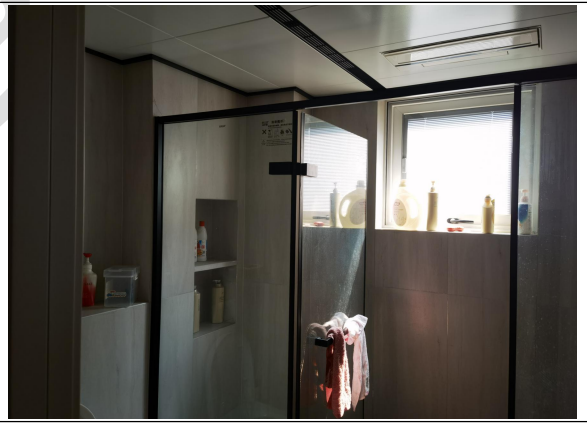
估价对象现场状况