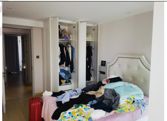
估价对象现场状况