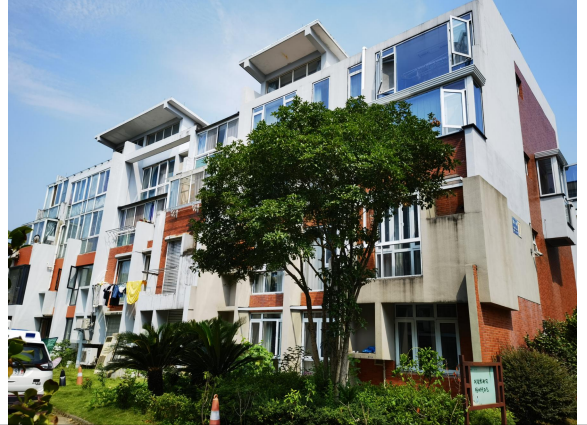
估价对象现场状况