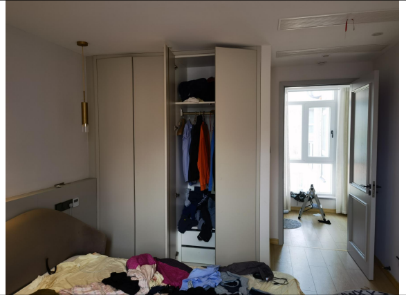
估价对象现场状况