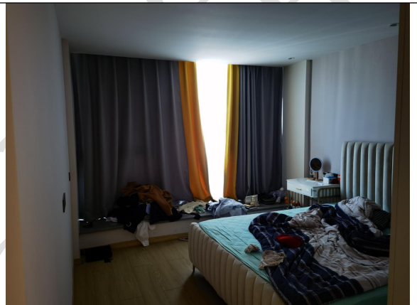
估价对象现场状况