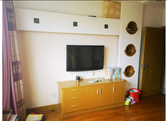
估价对象现场状况（401室）