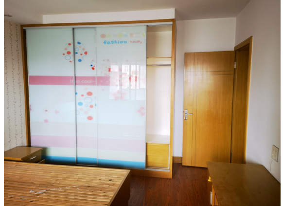
估价对象现场状况（501室）