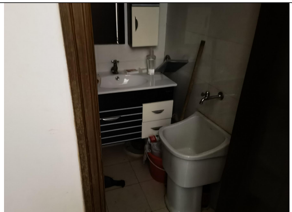
估价对象现场状况（S9号）