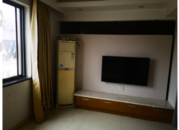
估价对象现场状况（401室）