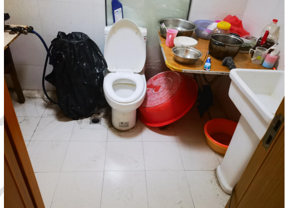
估价对象现场状况（201室）