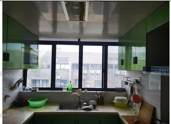
估价对象现场状况（501室）