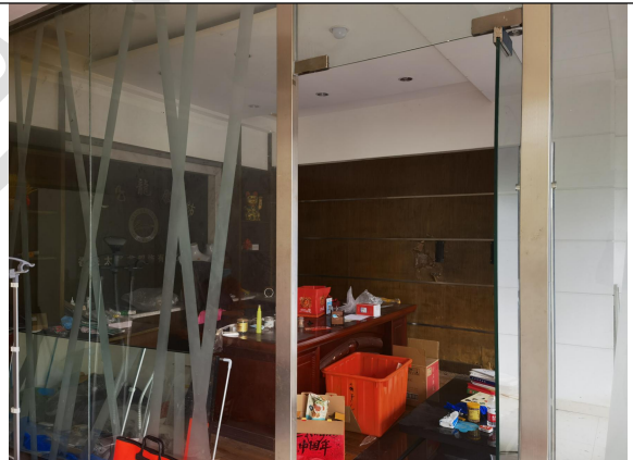
估价对象现场状况（S9号）