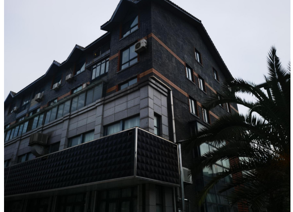
估价对象现场状况（外观）