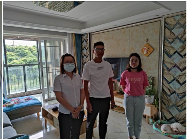
估价师实地查勘照片