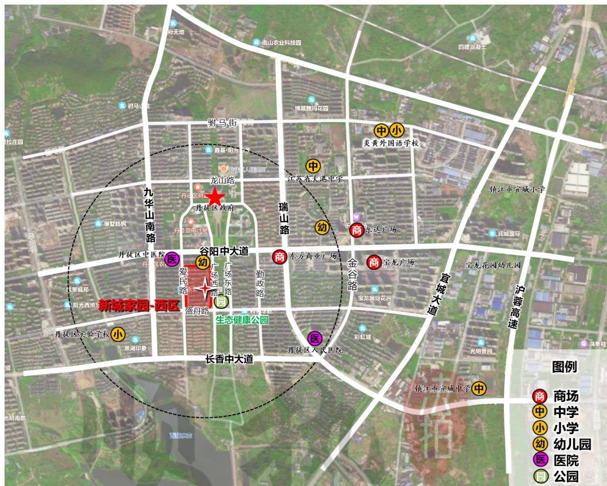
图 1 丹徒新城家园西区 13 幢第 3 层 303 室不动产区位及周边配套设施分析图

询价对象 1km 范围内有丹徒区中医院、丹徒区人民医院、江苏省大港中学、丹徒区实验学校、新城中心幼儿园等公共服务设施。小区所在区域文化、教育、体育、卫生等公共服务设施配套较齐全。市政供水、供电、供燃气、通信、排水等市政基础设施条件良好。