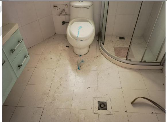
估价对象现场状况