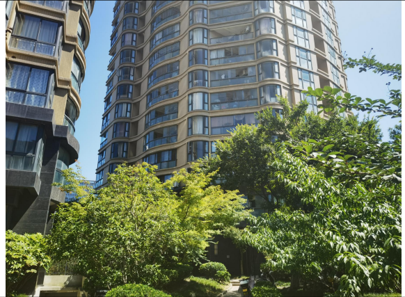
估价对象现场状况