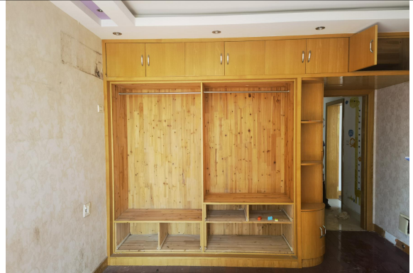
估价对象现场状况