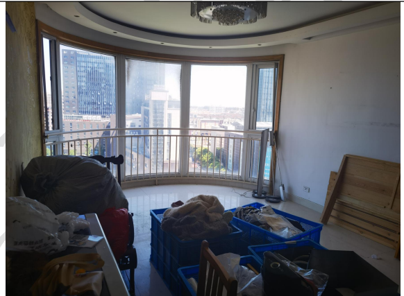
估价对象现场状况