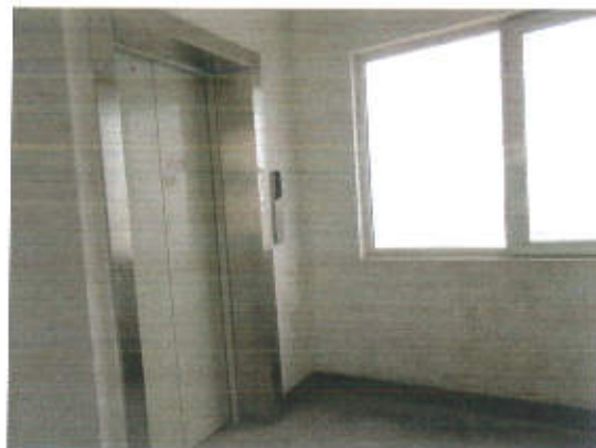
估价对象利用现状照片