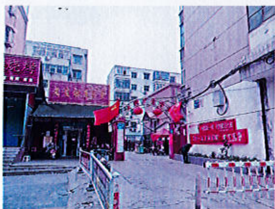
(南阳市) 中州西路 159 号 8 幢 1 单元 1 层 101 号房地产内外部照片