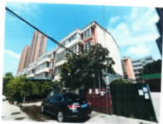
新乡市黄河大道 97 号靖宜小区 3 号楼东 2 单元 1-2 层西户