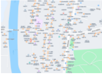
估价对象所在地理位置