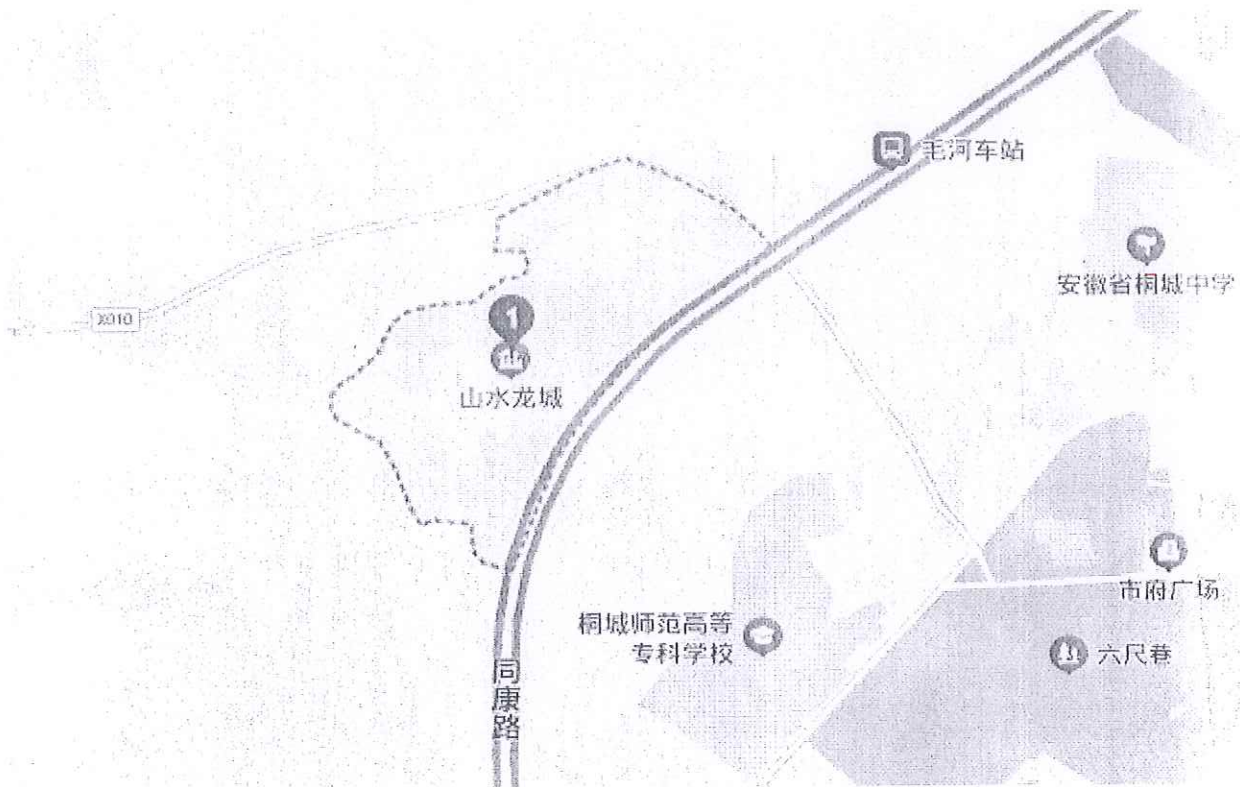
估价对象示意图（图中标识为估价对象位置）