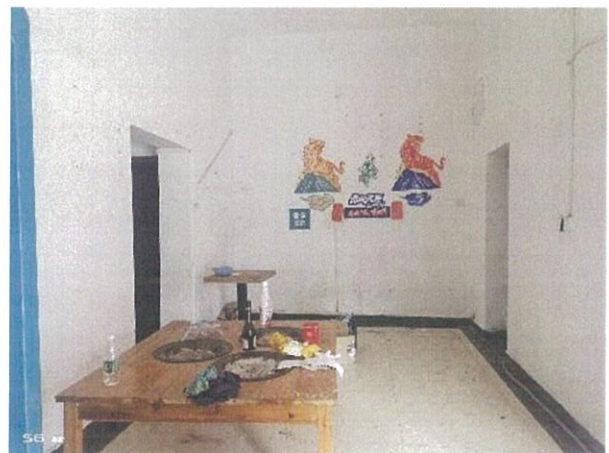
估价对象内部状况四