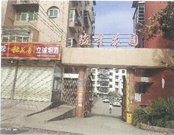
估价对象小区入口一