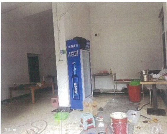
估价对象内部状况三