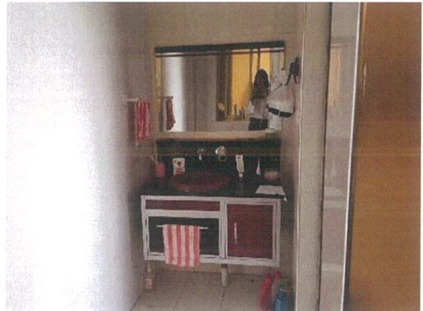
估价对象内部状况二