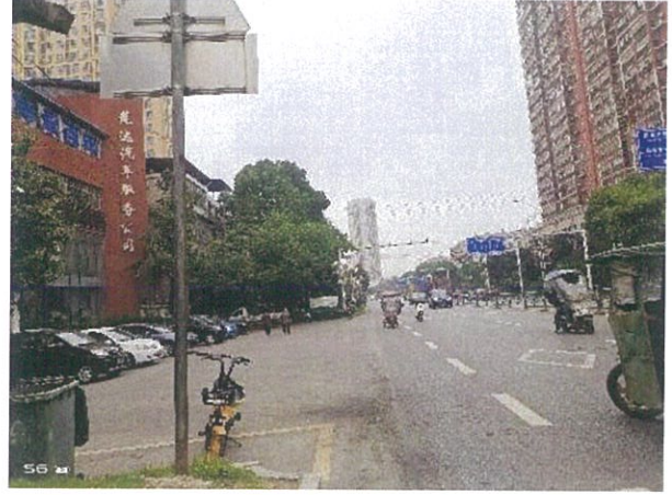
估价对象周边道路