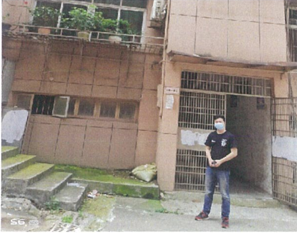
估价对象单元入口