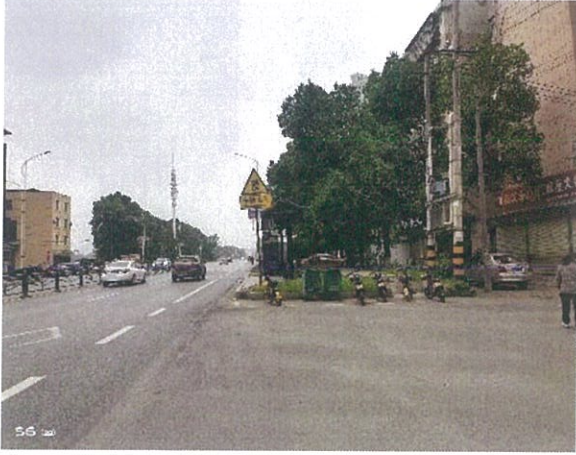
估价对象周边道路