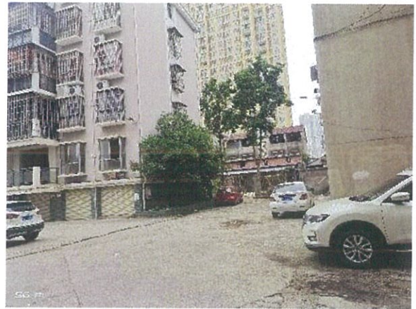
估价对象小区环境