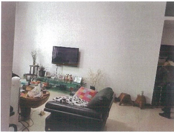
估价对象内部状况一