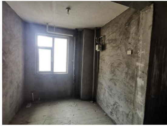
估价对象内外部状况及周围环境和景观照片