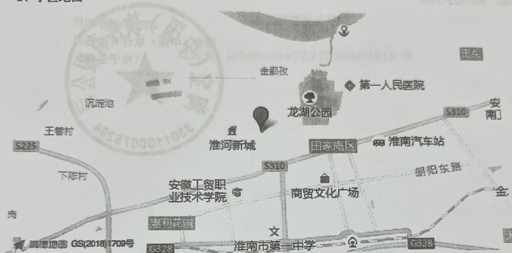
注: 数据源自高德地图, 根据询价方提供的标的物房屋坐落信息生成定位标注, 仅供参考