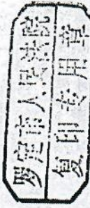
恒晖翰林苑商住小区楼盘表

根据贵院来函（2021）粤 5381 执 173 号要求，我局在云浮市产权与交易管理信息平台查询到罗定市恒晖苑房地产开发有限公司开发的恒晖翰林苑商住小区房屋建筑面积等详细资料如下：