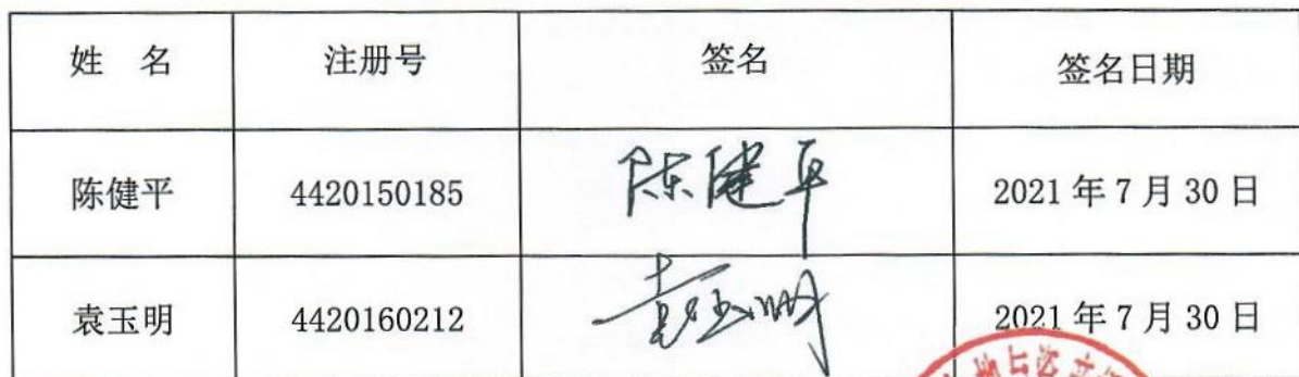
参加估价的注册房地产估价师