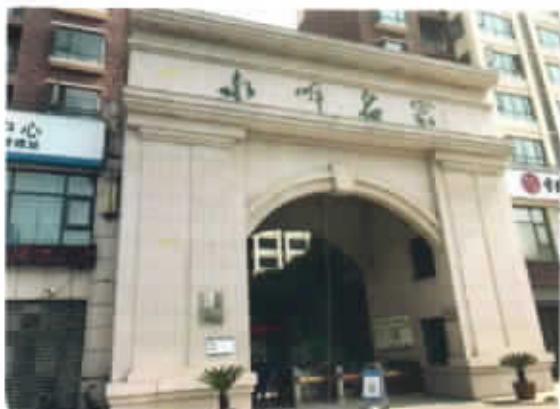
估价对象房屋内外部照片