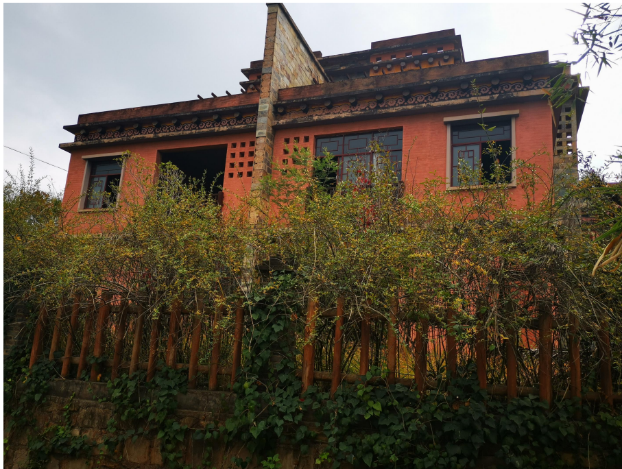
298.61 m 2 别墅外观