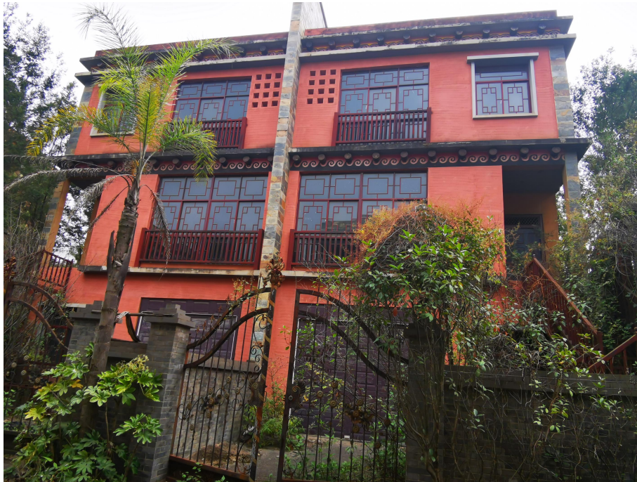
403.49 m 2 别墅外观