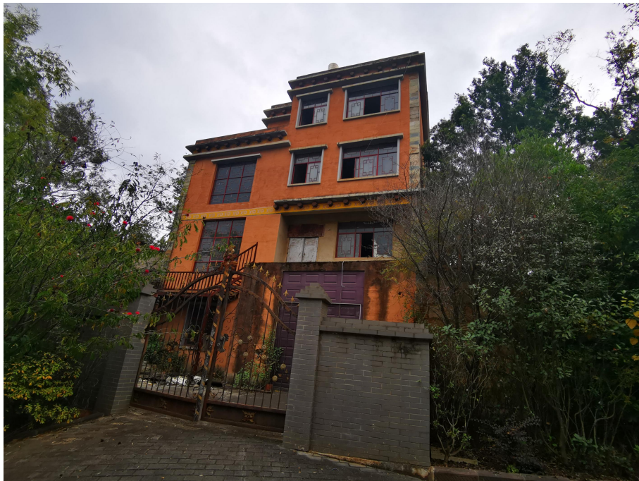
613.92 m 2 别墅外观