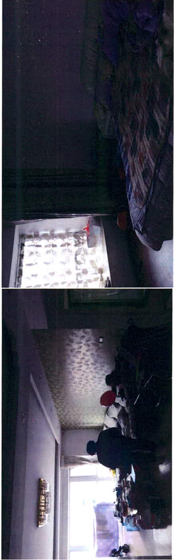
大理惠丰新城诏园3幢1单元11层1106号房产部分实物照片