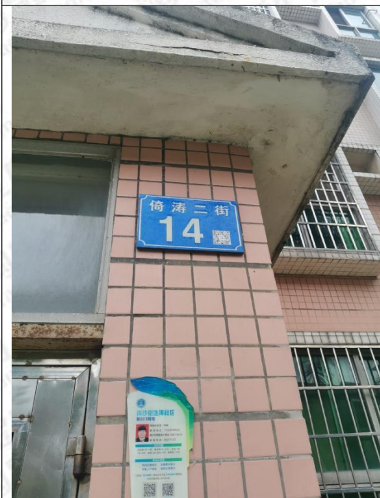
楼宇行政地址（信箱）