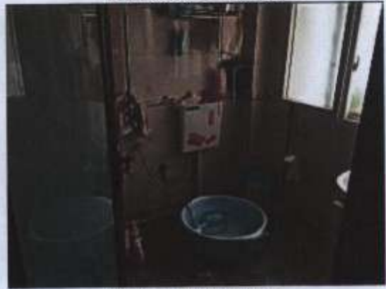
估价对象室内状况