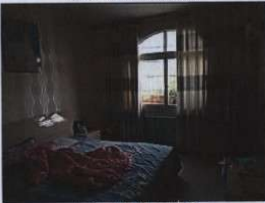
估价对象室内状况