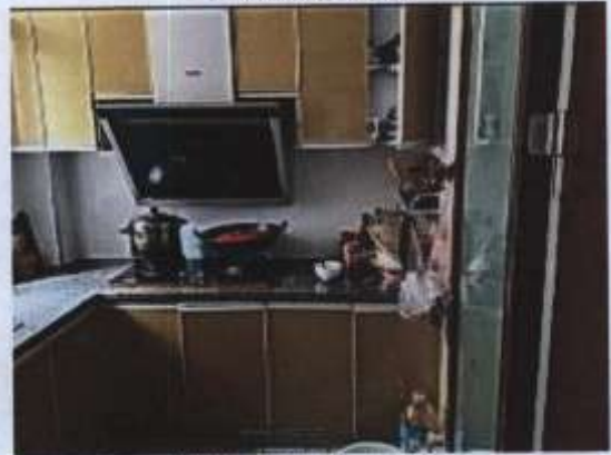
估价对象室内状况