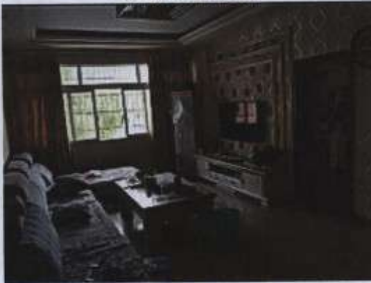
估价对象室内状况