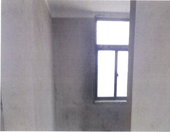
估价对象室内状况三