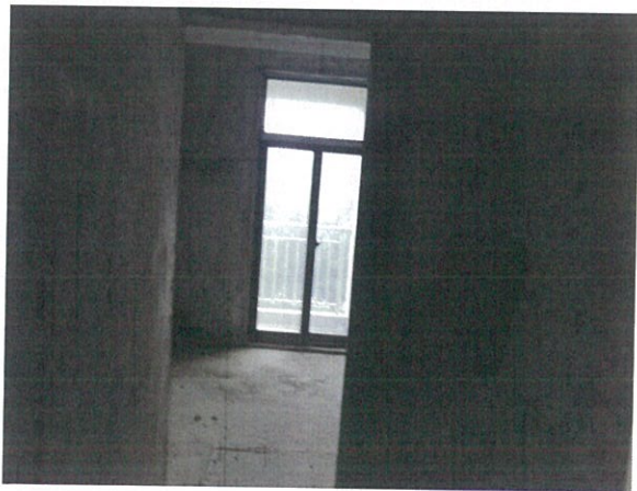
估价对象室内状况一