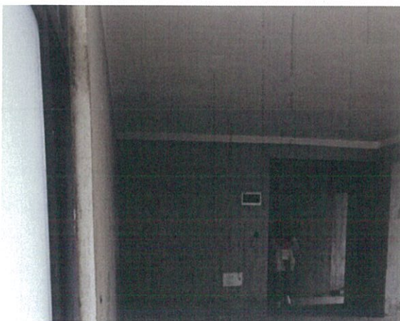
估价对象室内状况七