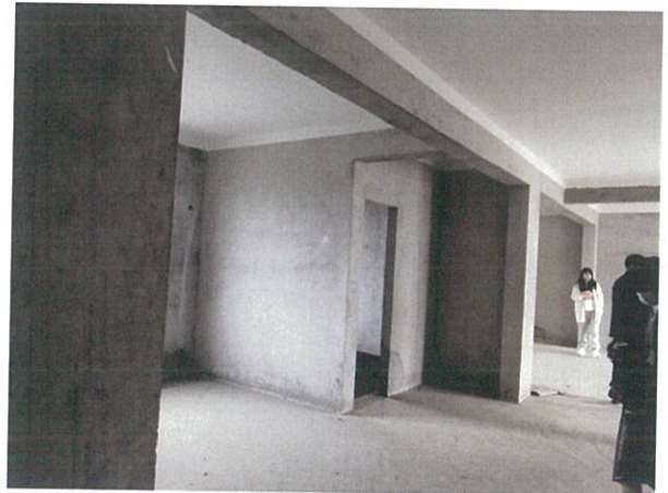
估价对象室内状况二