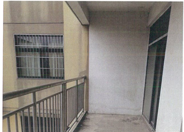
估价对象室内状况六