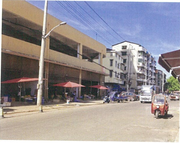
估价对象周边道路