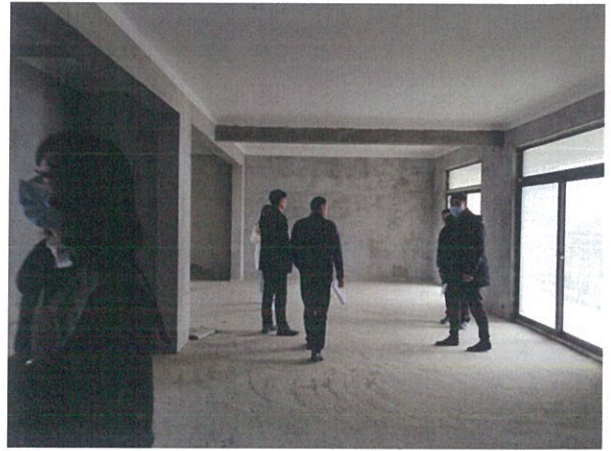
估价对象室内状况八