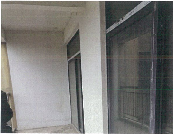
估价对象室内状况五