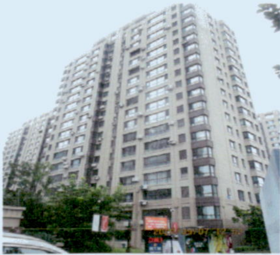
估价对象所在楼外景