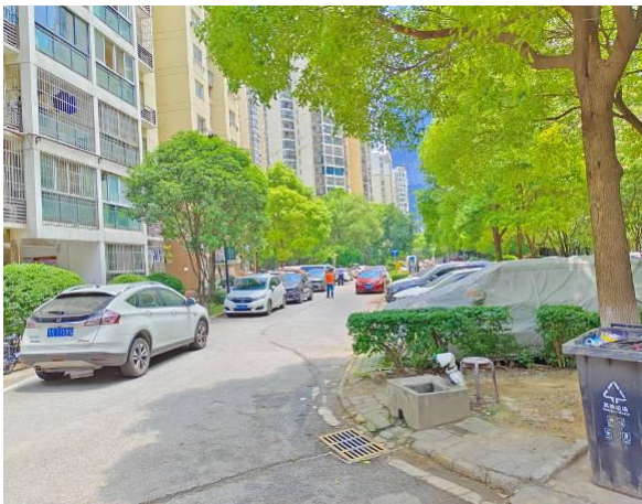
估价对象小区环境