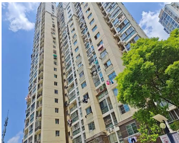
估价对象楼栋外观