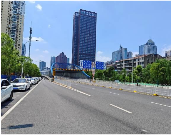
估价对象周边道路