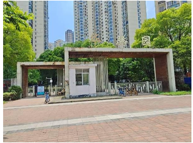
估价对象小区入口