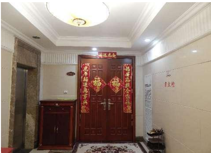
恒大华府 6 号楼 2801 入户门照片