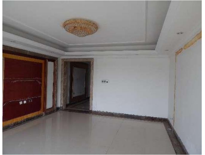
恒大华府 6 号楼 3102 室内照片