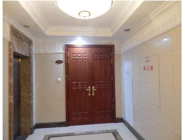
恒大华府 6 号楼 1801 入户门照片