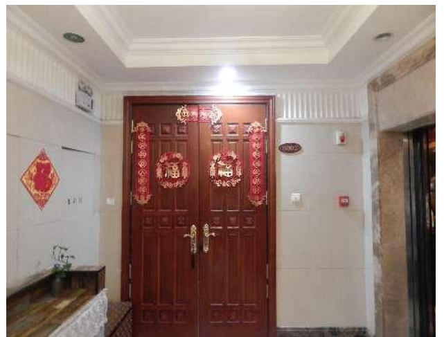
恒大华府 6 号楼 3002 入户门照片