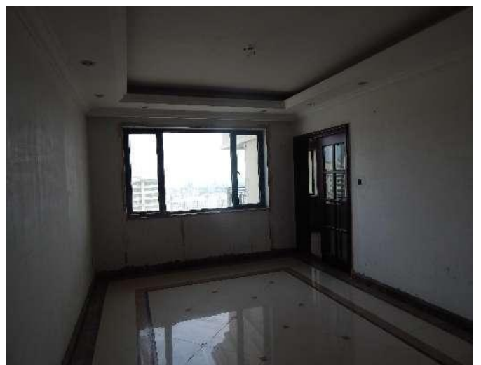
恒大华府 6 号楼 3102 室内照片