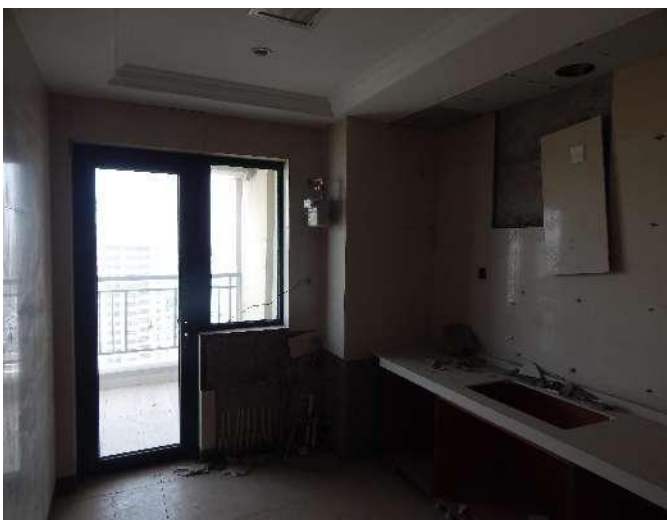
恒大华府 6 号楼 3102 室内照片