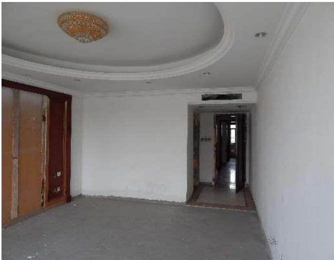
恒大华府 6 号楼 3102 室内照片