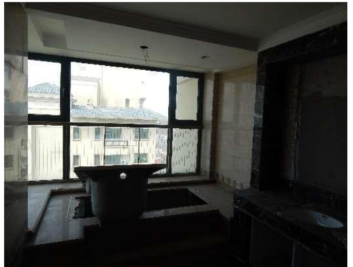
恒大华府 6 号楼 3102 室内照片