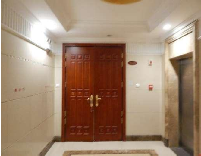
恒大华府 6 号楼 3102 入户门照片