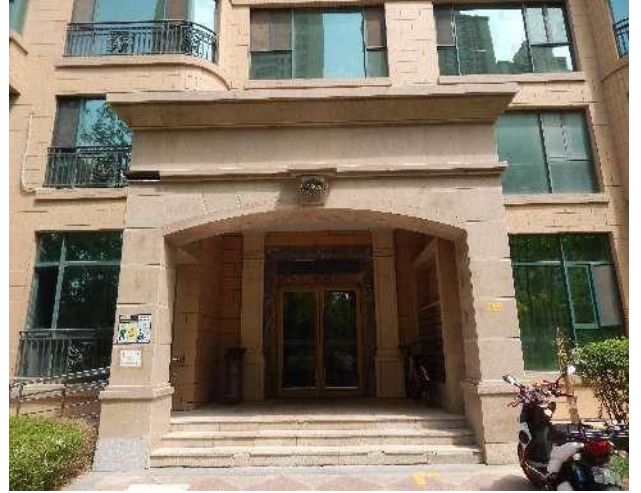
估价对象所在建筑物单元门照片