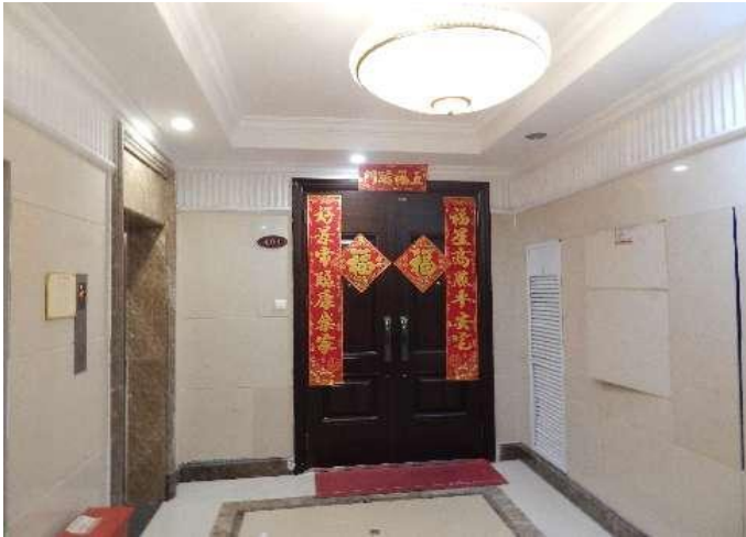
恒大华府 6 号楼 401 入户门照片