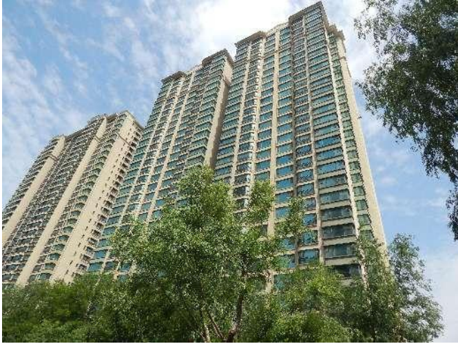
估价对象所在建筑物外观照片