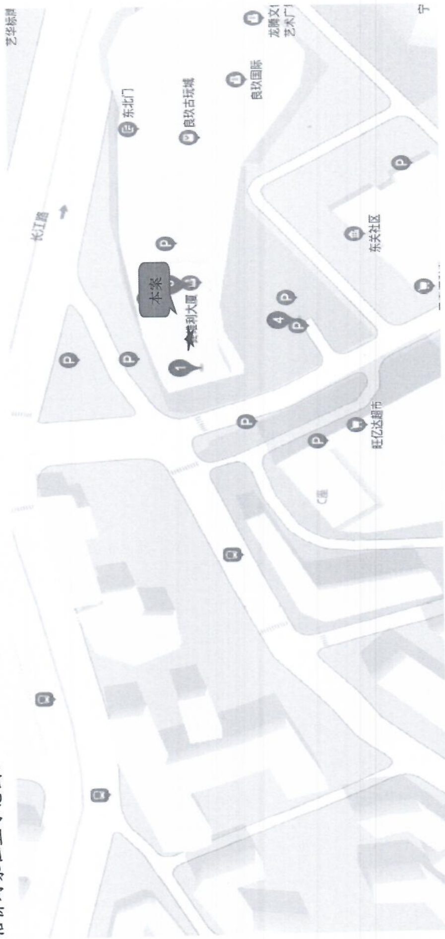
估价对象位置示意图：