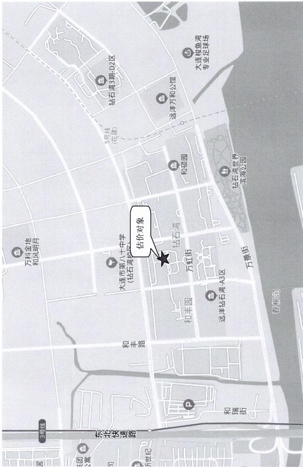
估价对象位置示意图