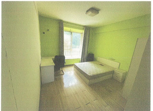
估价对象室内现状