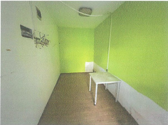
估价对象室内现状