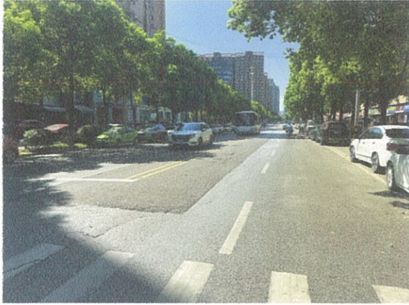
估价对象周边道路