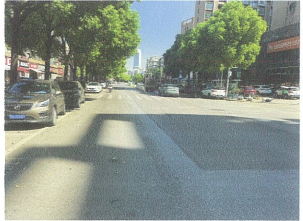
估价对象周边道路