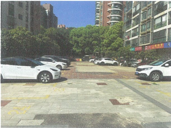
估价对象小区入口