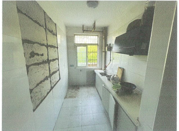
估价对象室内现状