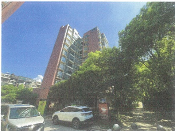
估价对象建筑物外观