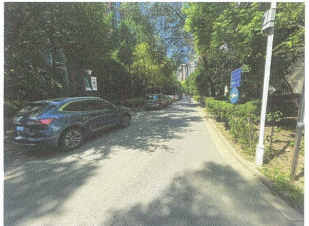
估价对象小区环境