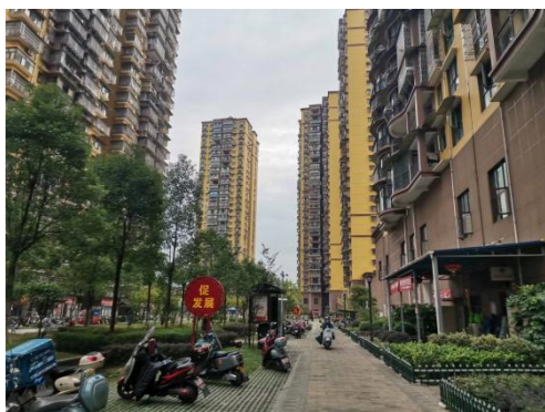
估价对象周边环境