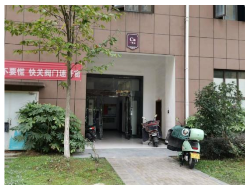
估价对象单元入口