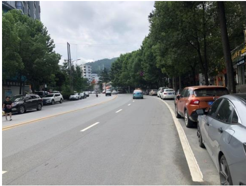
周边道路状况(车城南路)