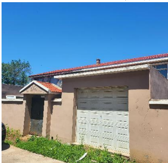
估价对象院落大门、附属用房正面外观