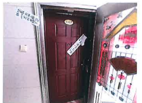
估价对象入户大门