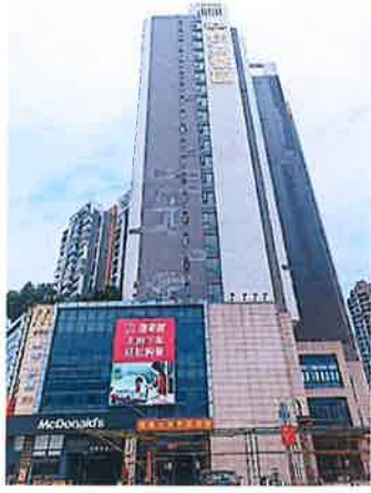
估价对象所在建筑物外观