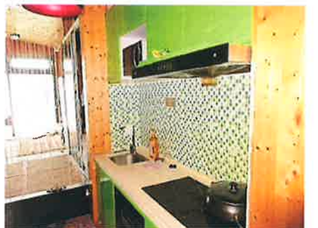
估价对象内部状况