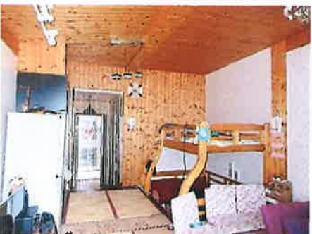
估价对象内部状况