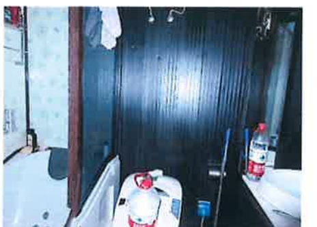
估价对象内部状况