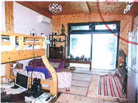
估价对象内部状况