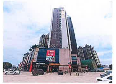
估价对象小区道路