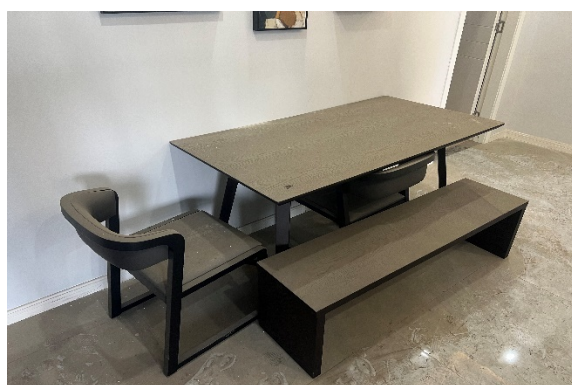
饭桌1 (一张桌子、2对凳子、一张长凳子)