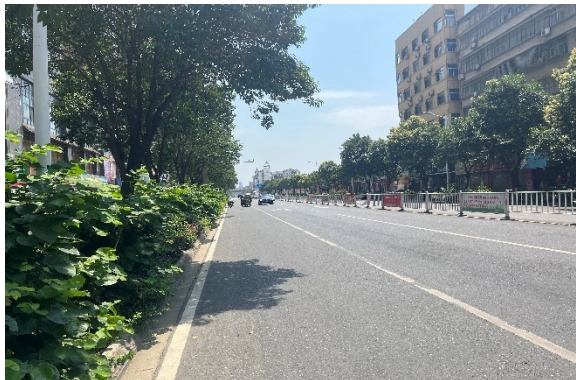
临路状况 1 (青年路)