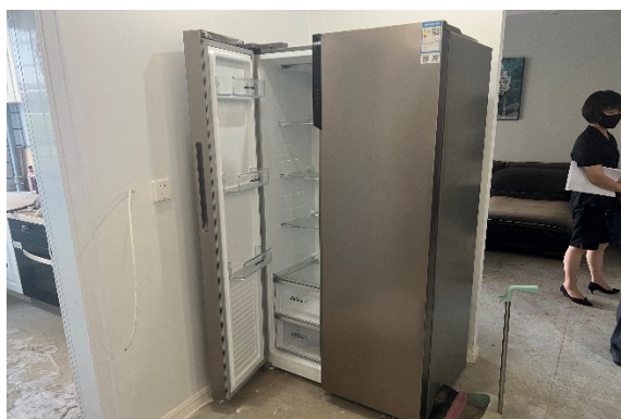
冰箱 ( 美菱 BCD—552wupc )