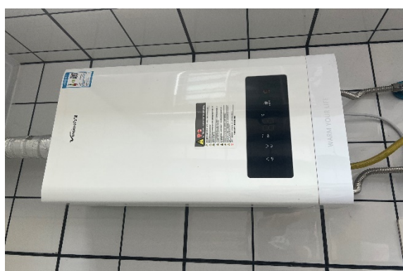
热水器 (万和热水器 25KW)