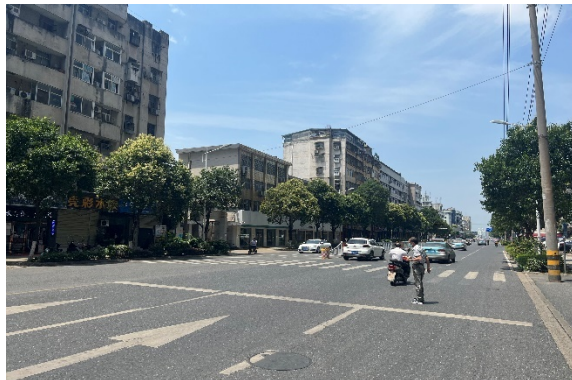
临路状况 2 (青年路)