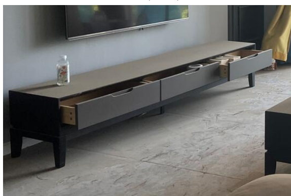
电视柜 (1.95m×0.4 m)