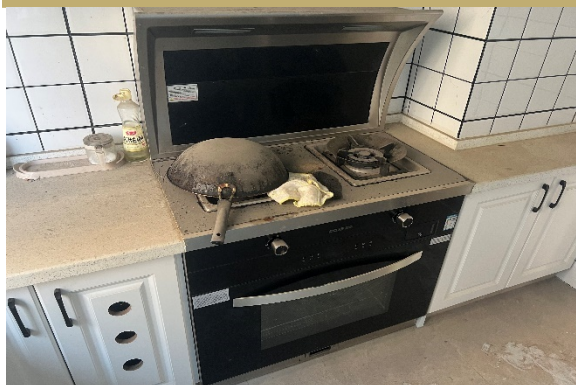
集成灶 ( 超洁集成灶 JJZT-A-A ( 4.2KW ) )