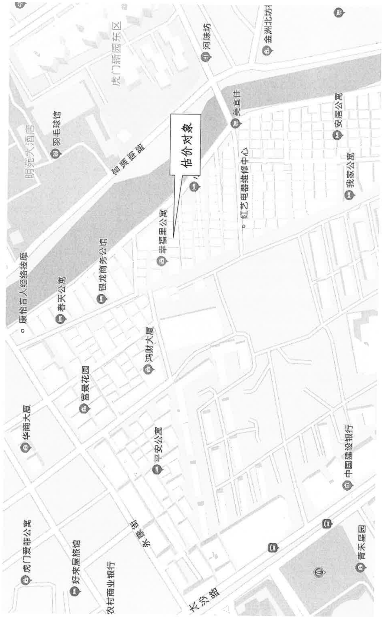
估价对象位置示意图