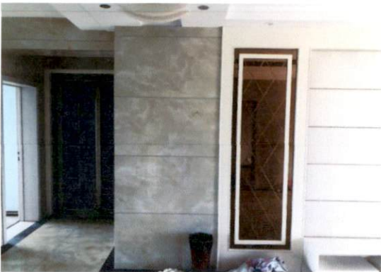
估价对象内部状况