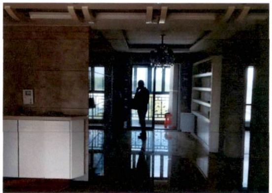
估价对象内部状况