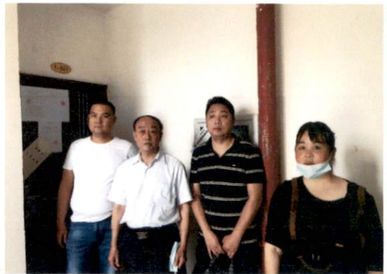
估价对象大门状况