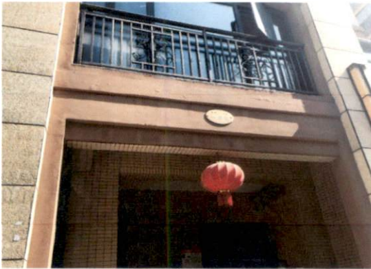
估价对象所在单元