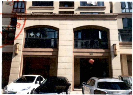
估价对象所在楼栋