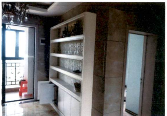
估价对象内部状况