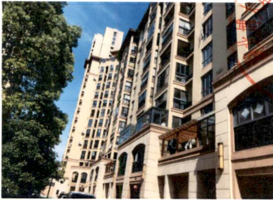
估价对象所在小区