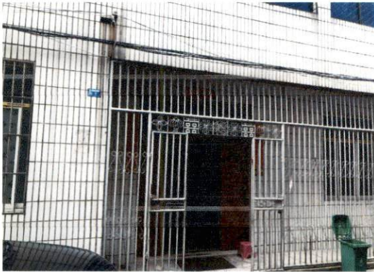
估价对象大门状况