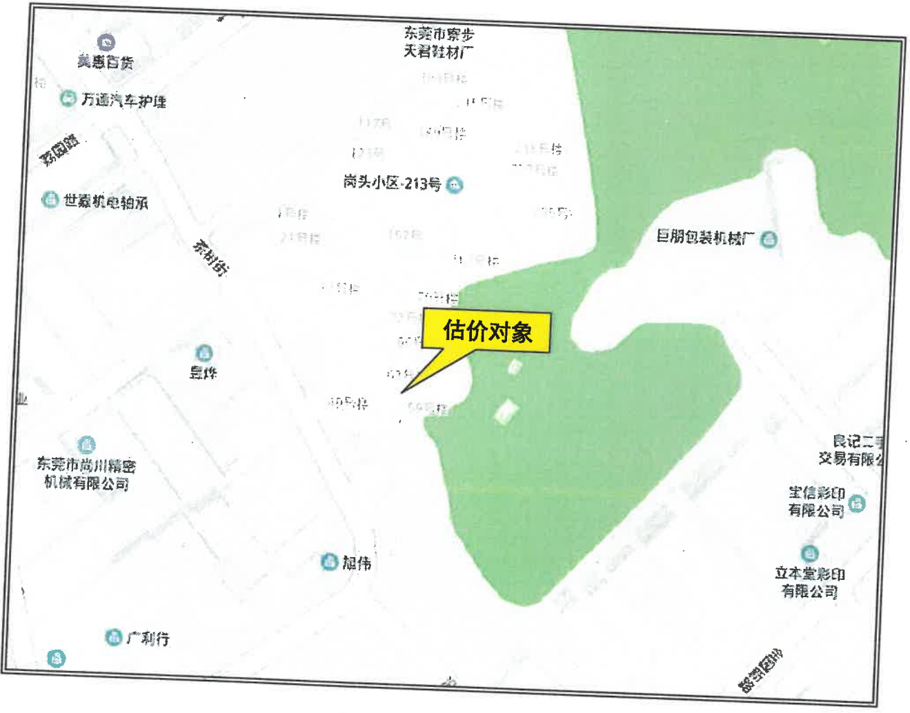
附件（二）：估价对象位置图