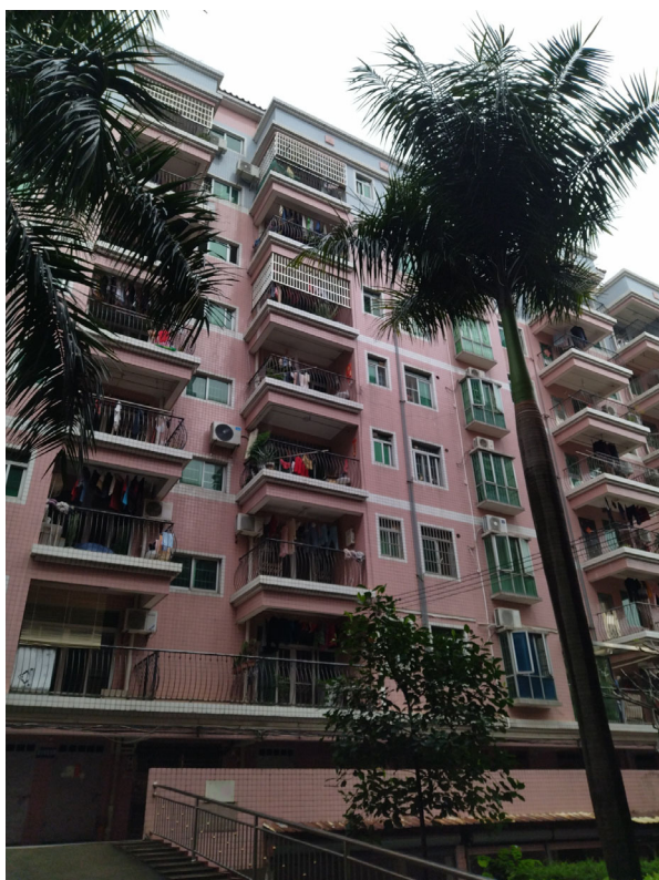
标的物所在楼宇外观