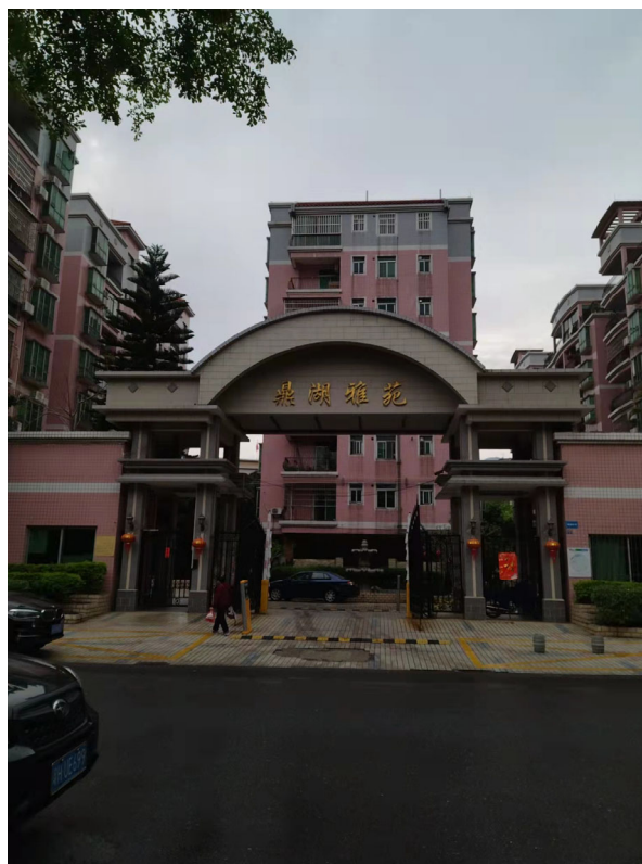
标的物所在小区入口