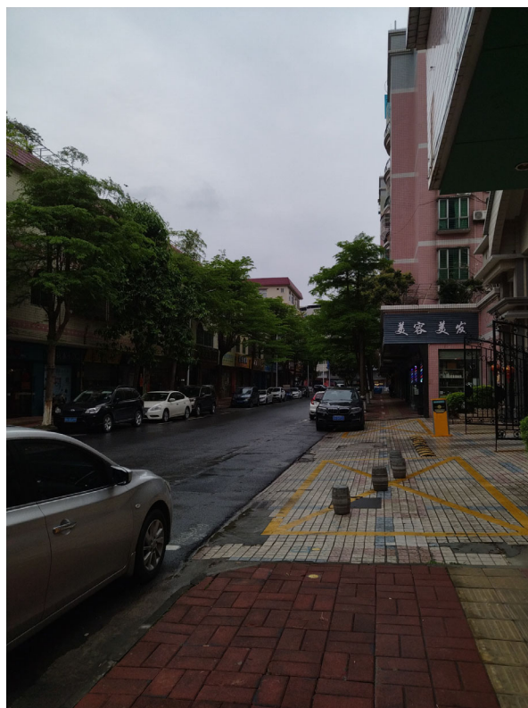
标的物所在小区周边环境