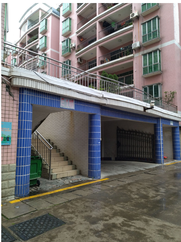
标的物所在小区内部环境