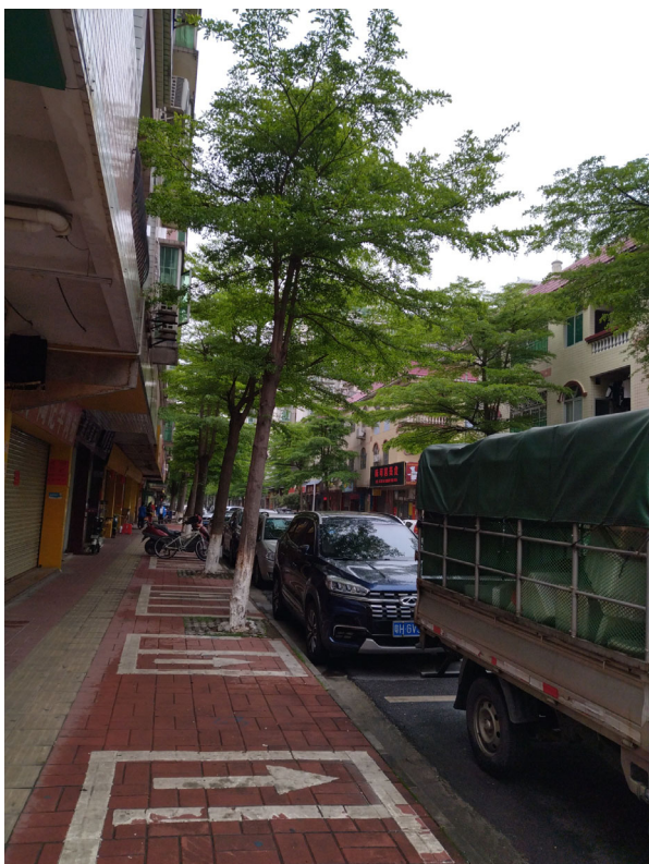
标的物所在小区周边环境