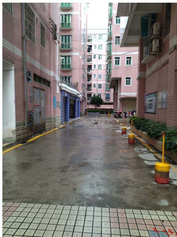
标的物所在小区内部环境