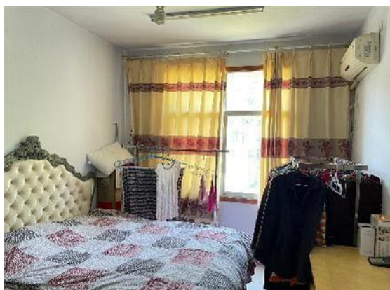
估价对象现状实景