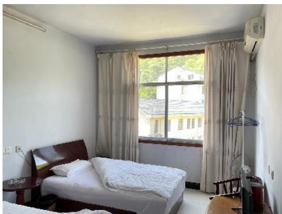
估价对象现状实景