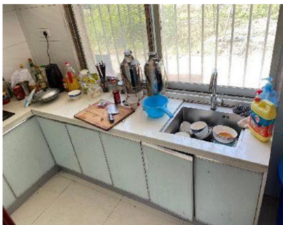
估价对象现状实景