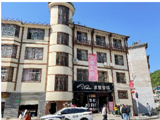
估价对象正立面外观