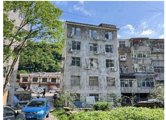
估价对象背离面外观