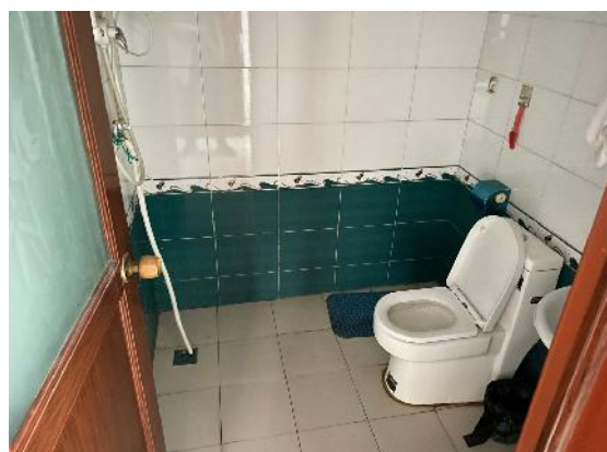
估价对象现状实景