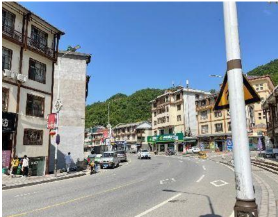
估价对象周边道路