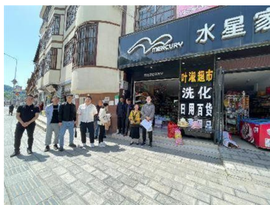
估价对象现状实景