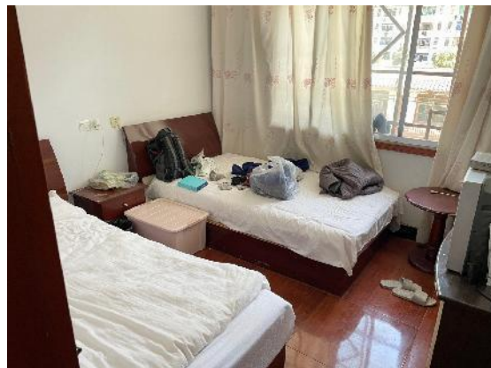
估价对象现状实景