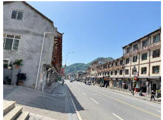
估价对象周边道路