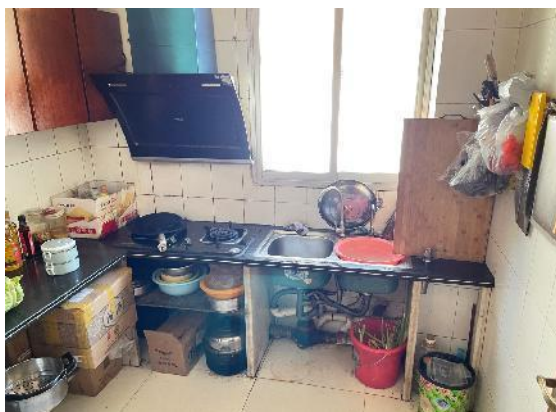
估价对象现状实景