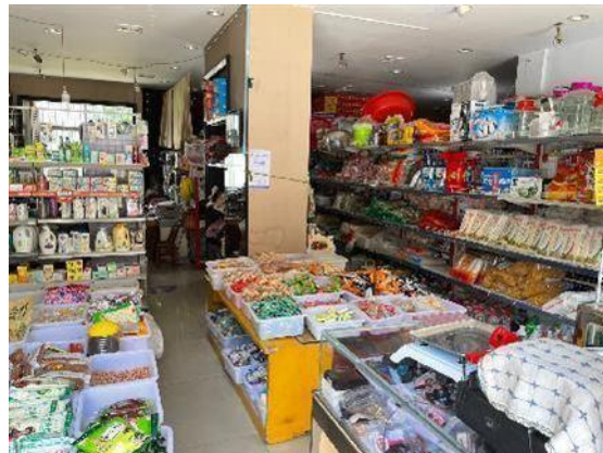
估价对象现状实景