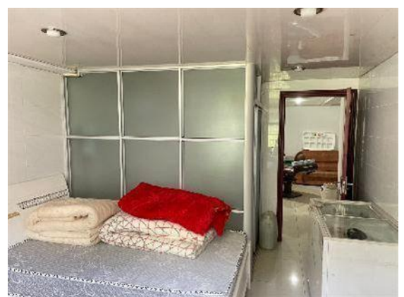
估价对象现状实景