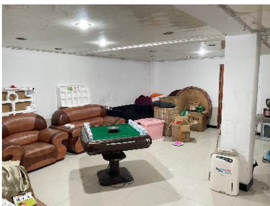
估价对象现状实景