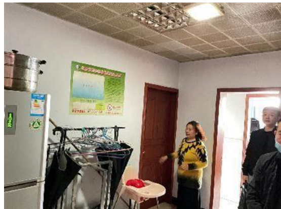
估价对象现状实景