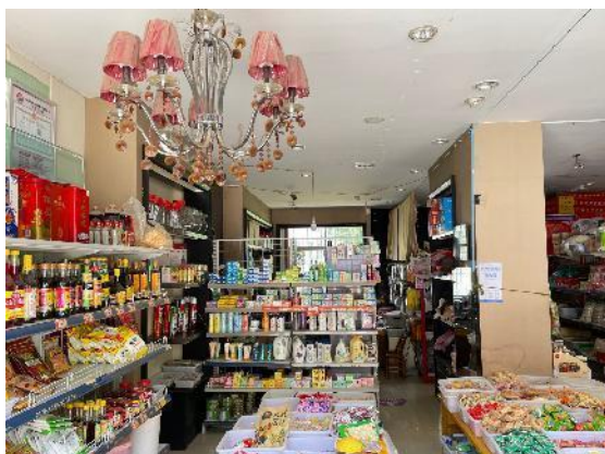
估价对象现状实景