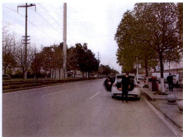
估价对象周边道路一