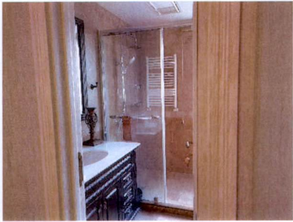
估价对象卫生间一