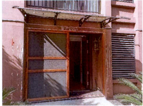
估价对象改装后的入户门