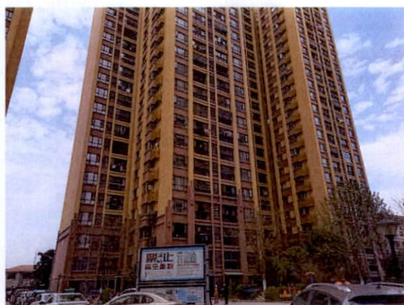
估价对象所在楼整体外观