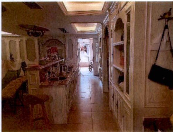
估价对象客厅状况一