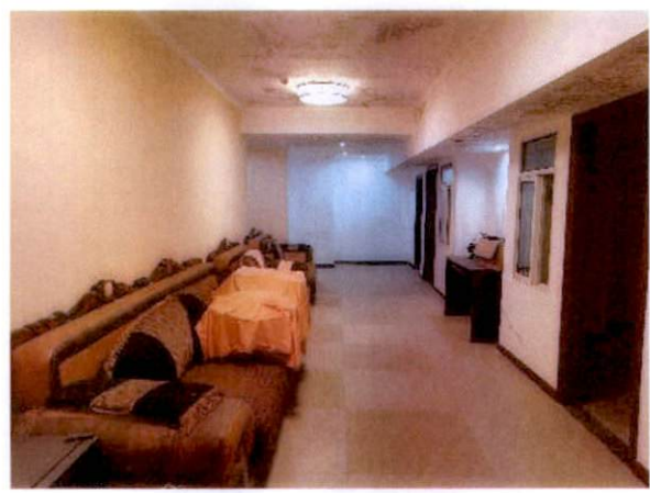
估价对象地下储藏室内部状况一