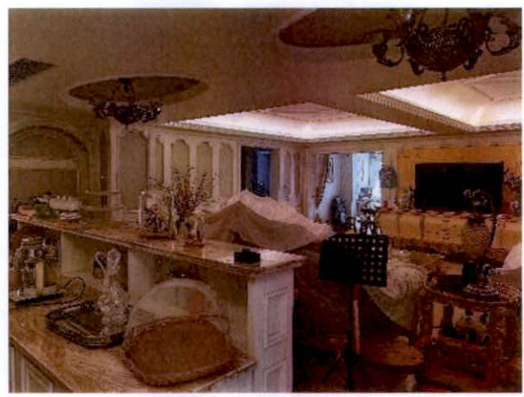
估价对象客厅状况二