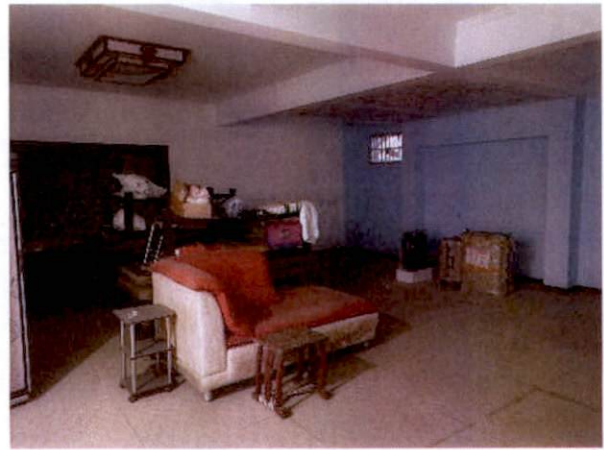
估价对象地下储藏室内部状况三