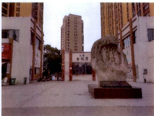
估价对象小区入口