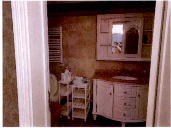
估价对象卫生间二