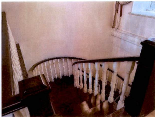
估价对象地下储藏室楼梯入口