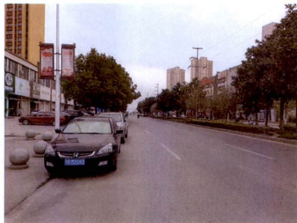
估价对象周边道路二