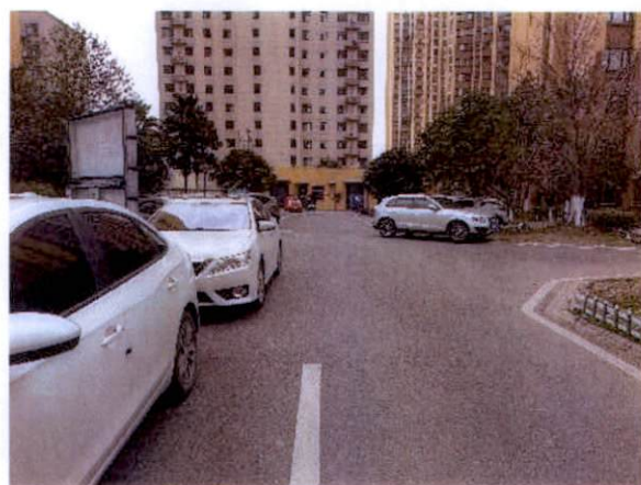
估价对象小区内道路