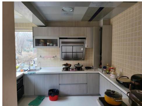
估价对象室内照片