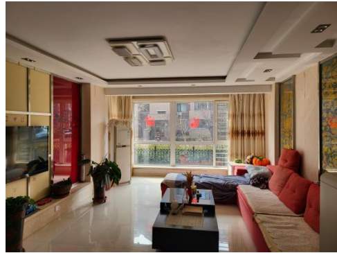
估价对象室内照片