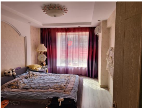
估价对象室内照片