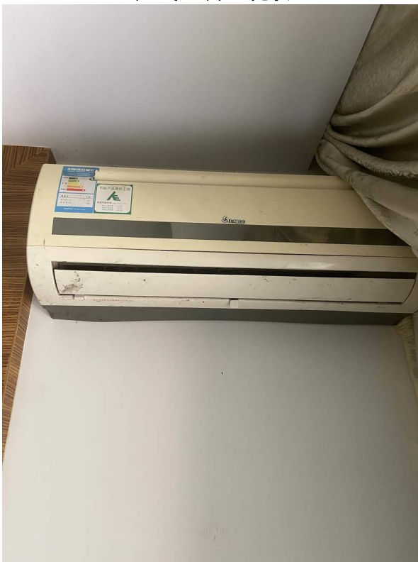
挂式空调 4 现状