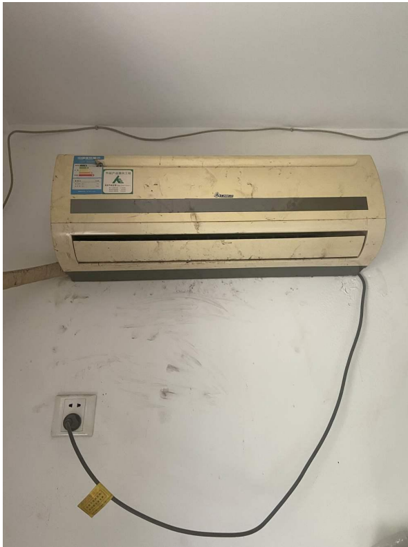
挂式空调 3 现状