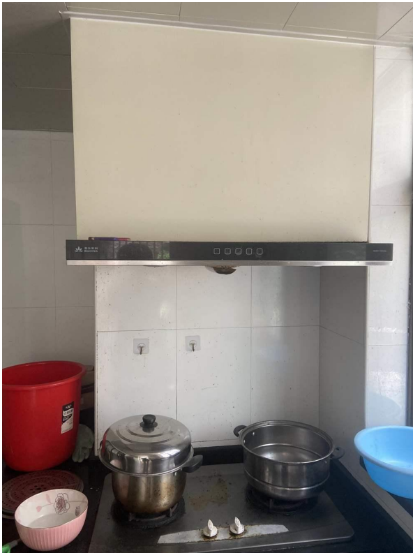
抽油烟机、炉灶现状