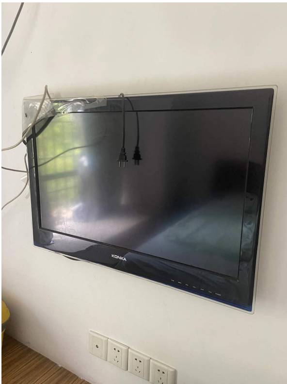
电视机 2 现状