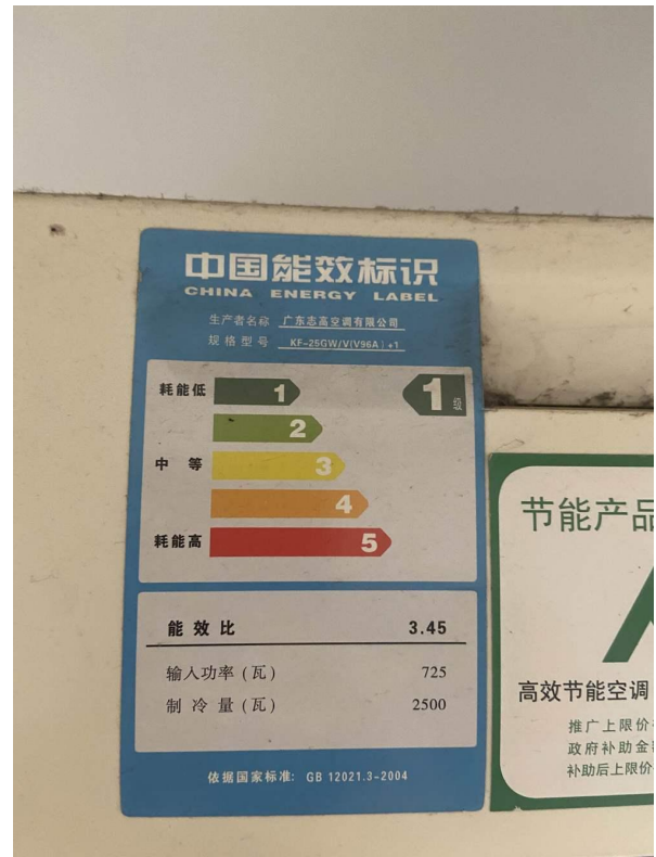
挂式空调 2 标识