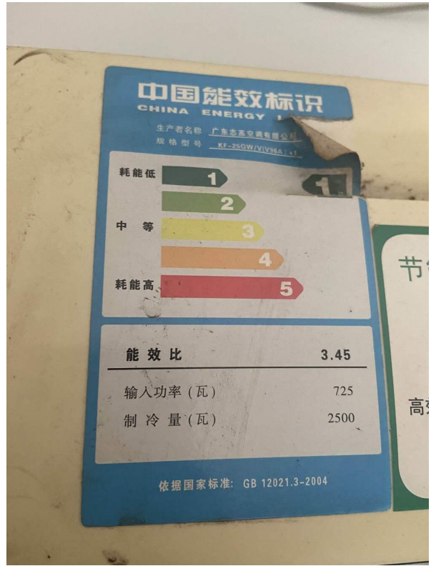
挂式空调 3 标识