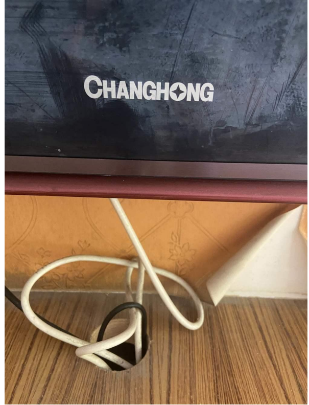
电视机 1 标识