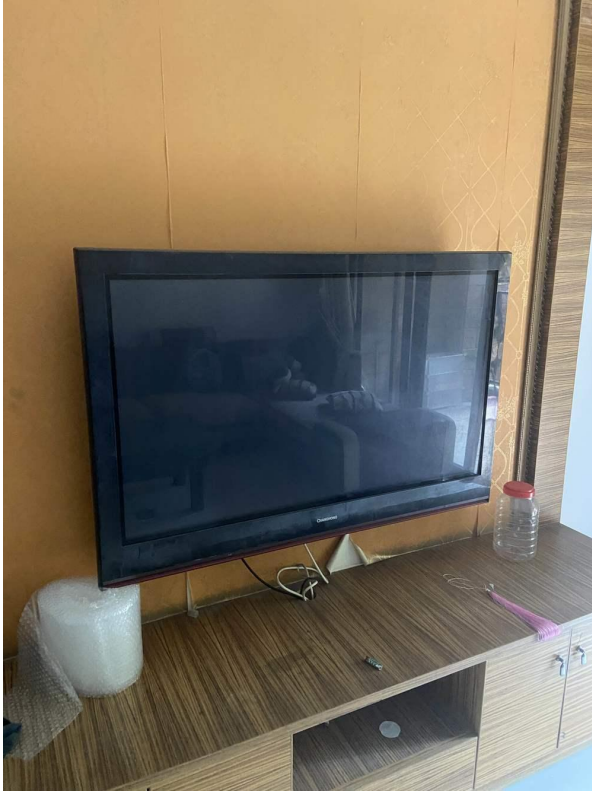
电视机 1 现状