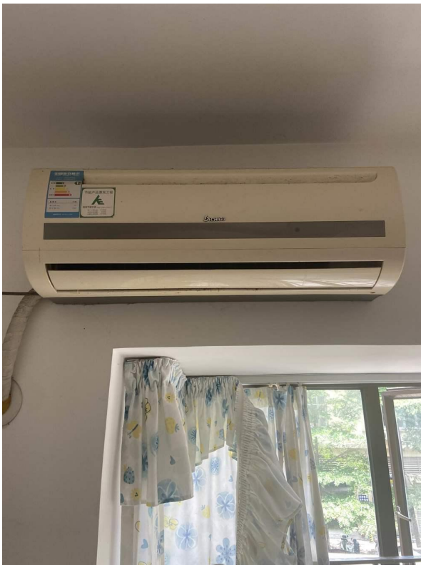
挂式空调 2 现状