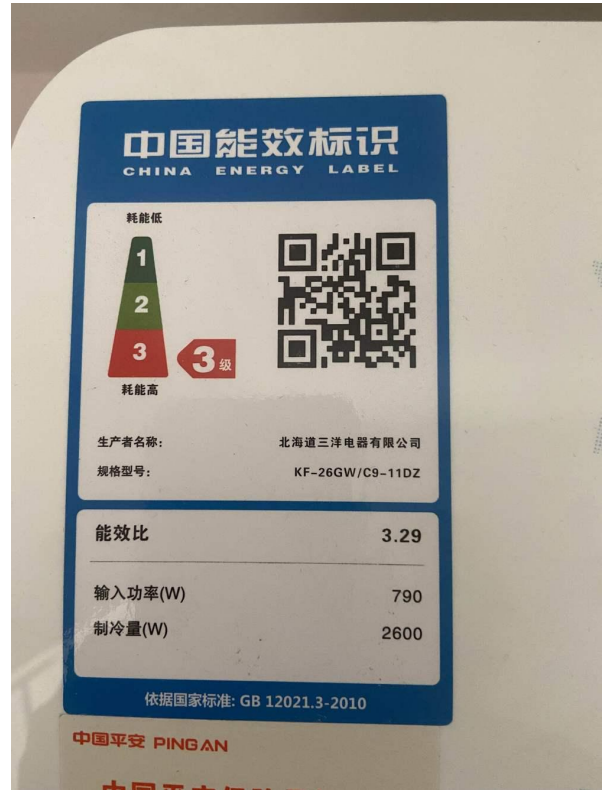
挂式空调 1 标识