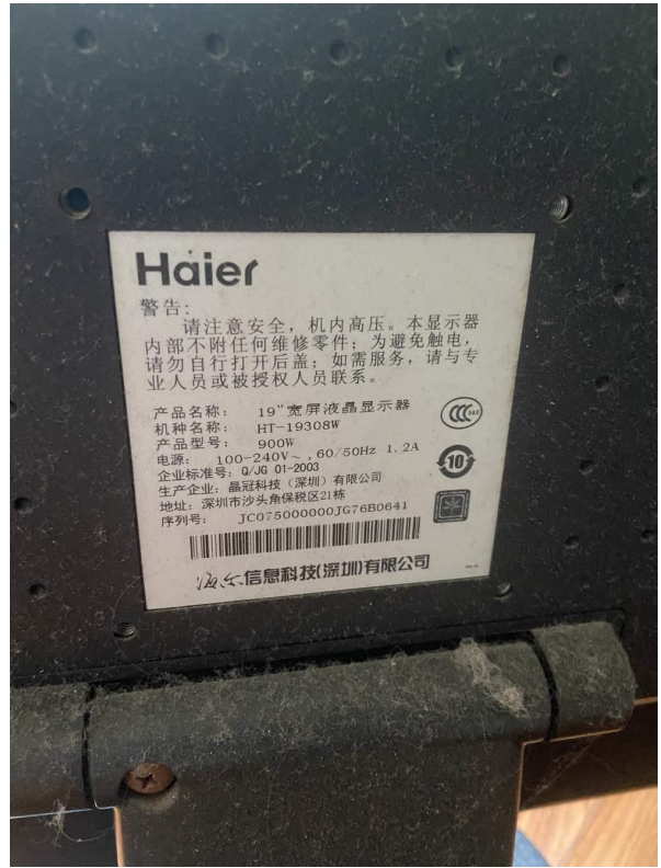
台式电脑（显示屏）标识