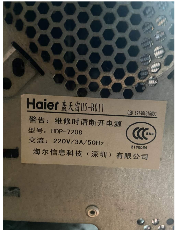
台式电脑（主机）标识