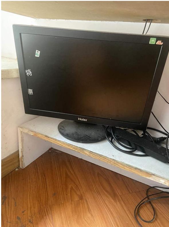
台式电脑（显示屏）现状