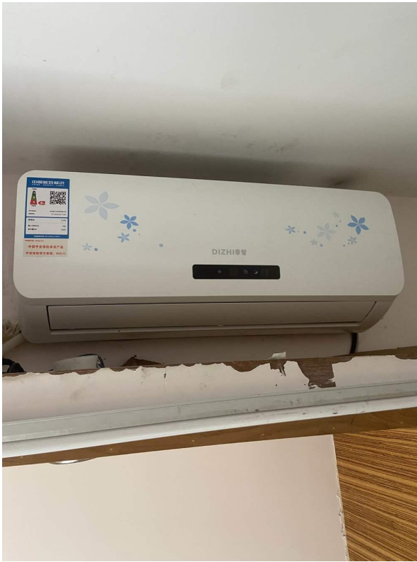
挂式空调 1 现状