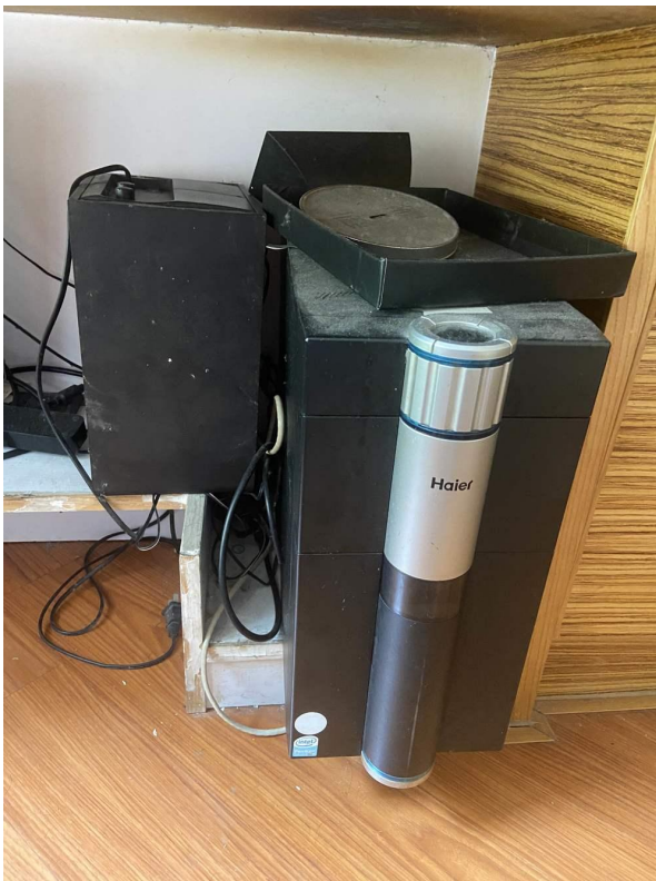
台式电脑（主机）现状