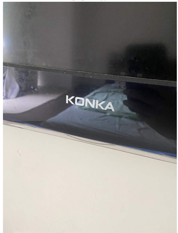
电视机 2 标识