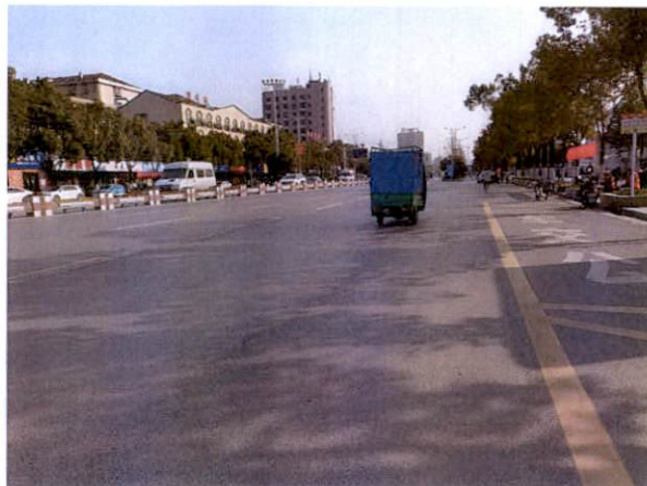
估价对象周边道路二