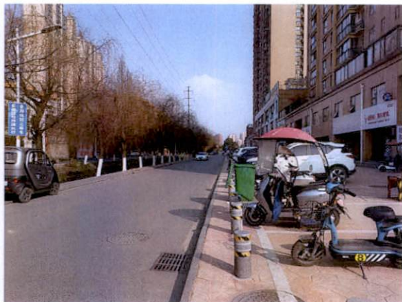
估价对象周边道路一