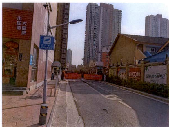
估价对象小区入口