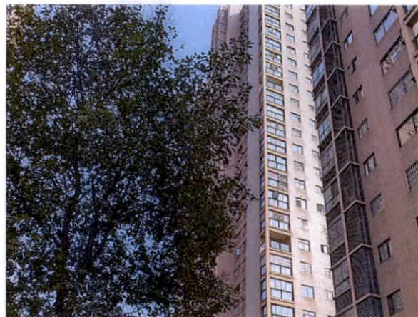
估价对象所在楼整体外观