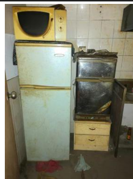
冰箱、消毒柜、微波炉