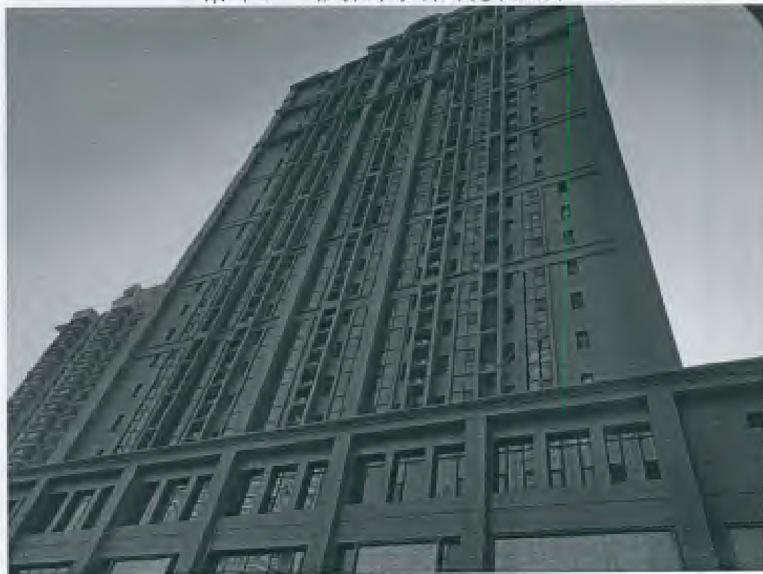
附件3 估价对象利用现状照片