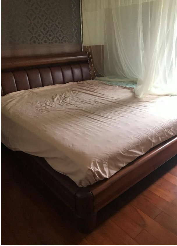
床 1 现状