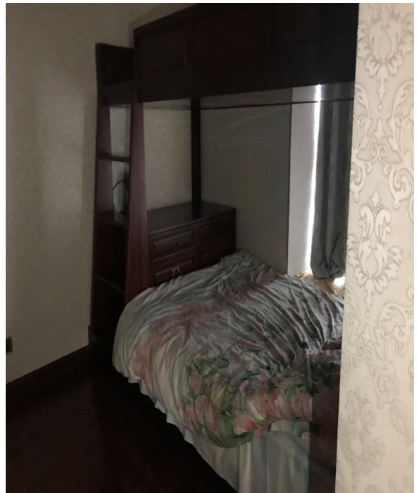
床 4 现状