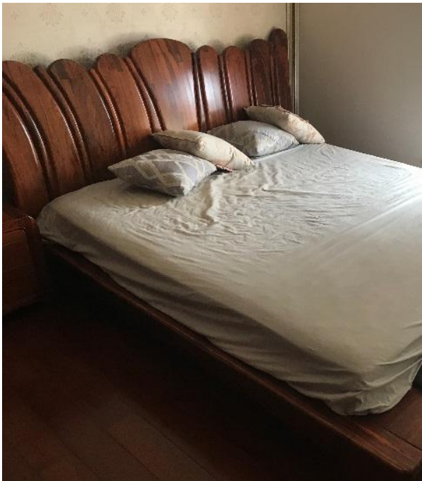
床 3 现状