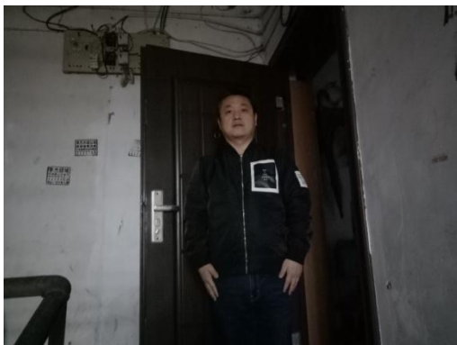
入户门及现场估价师