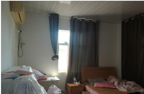
估价对象门口现状