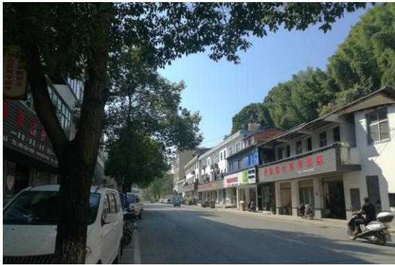
估价对象临路状况