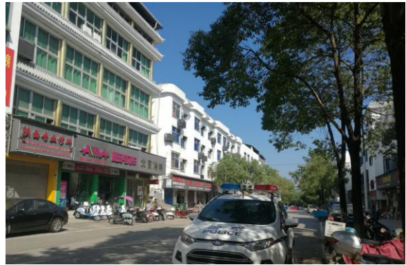
估价对象临路状况