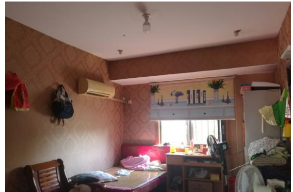
估价对象内部现状