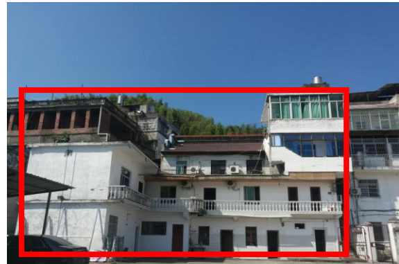
估价对象整体外观(后)