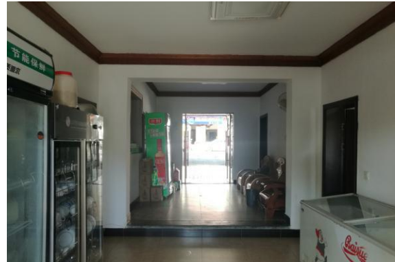
估价对象内部现状