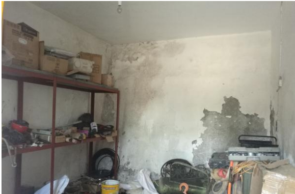
估价对象内部现状