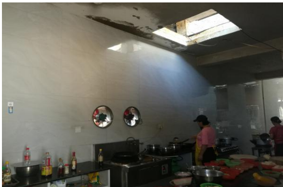
估价对象内部现状