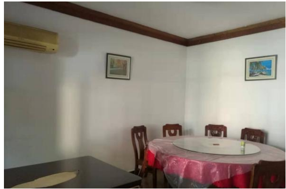
估价对象内部现状