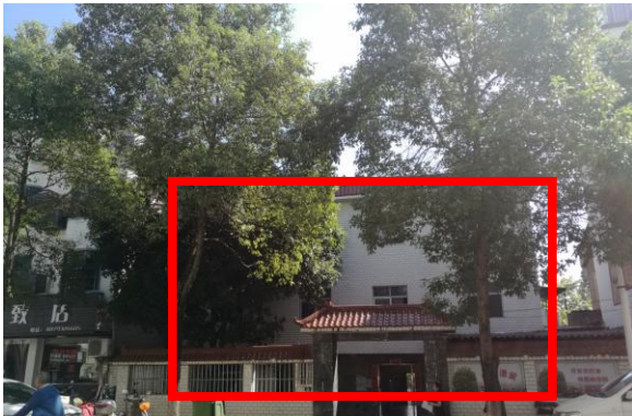
估价对象整体外观(前)