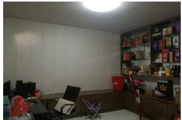
估价对象内部现状