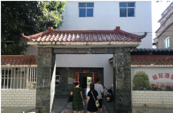
估价对象门口现状