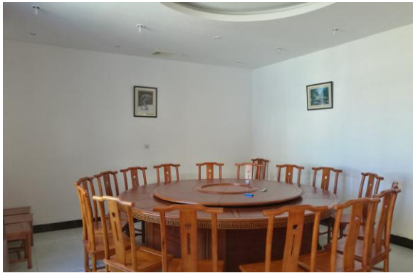
估价对象内部现状