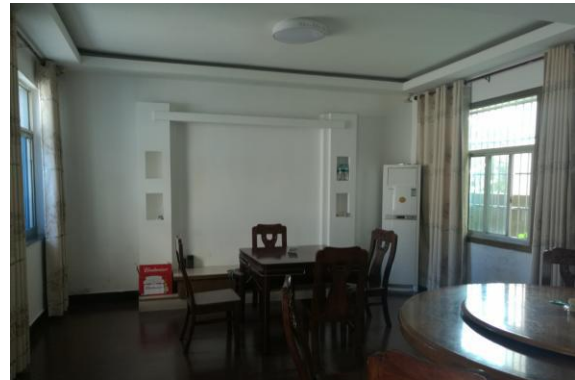
估价对象内部现状