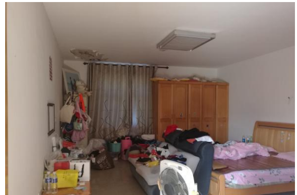
估价对象内部现状