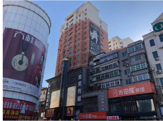
西五路 10 号楼