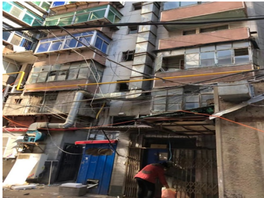
西六路 13 号楼