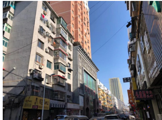
西六路 13 号楼