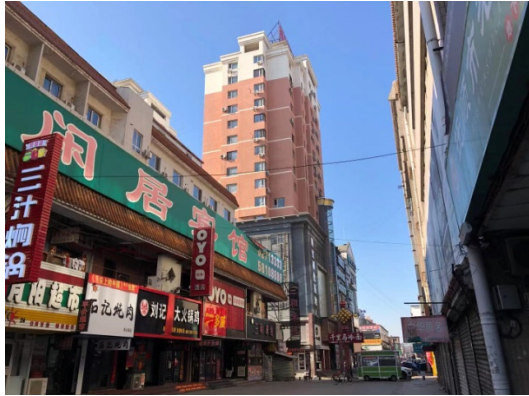
西五路 10 号楼