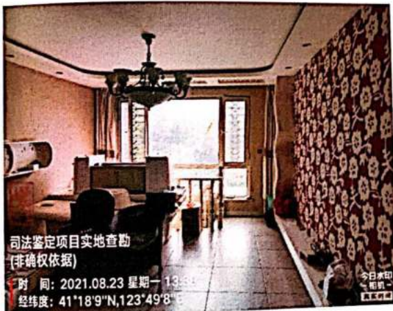
估价对象一层内景