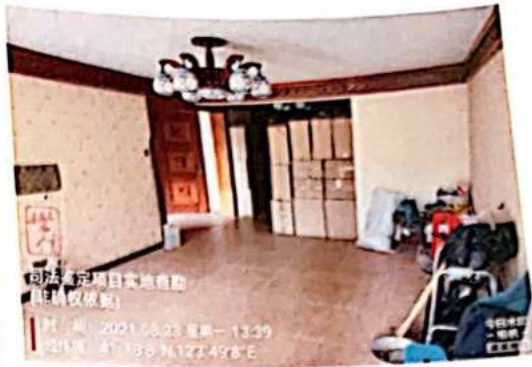
估价对象负一层内景