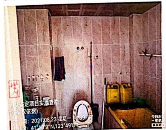
估价对象一层内景