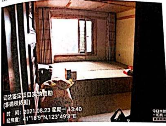
估价对象负一层内景