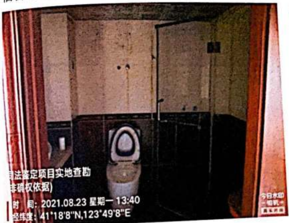
估价对象负一层内景