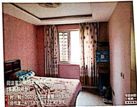
估价对象一层内景