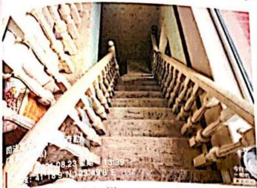
估价对象室内步行梯