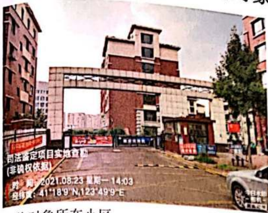
估价对象所在小区