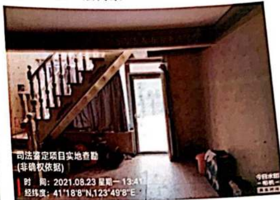
估价对象负一层内景