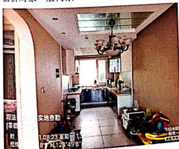
估价对象一层内景