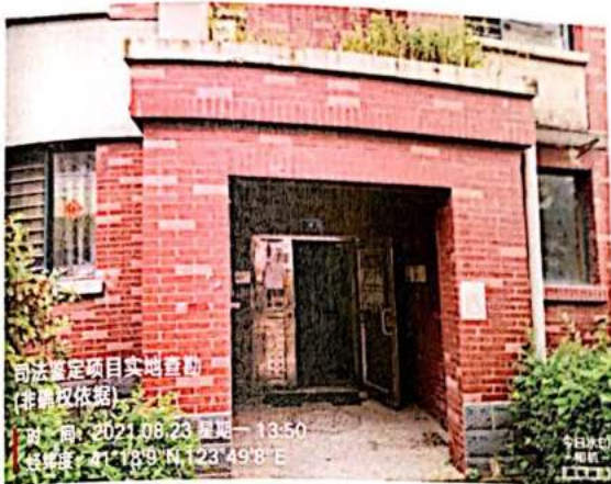
估价对象所在楼单元门